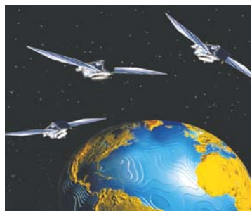
Fig.1. Sateliți GPS

GPS este un sistem mondial de radionavigare format dintr-o constelație de 24 de sateliți plasați pe orbită gravitând în jurul Pământului (figura 1) și din stațiile terestre aferente. Pentru calcularea poziției exacte se folosește principiul triangulației, fiind necesare coordonatele furnizate de trei sateliți. GPS folosește aceste stele artificiale ca puncte de referință pentru a calcula poziția terestră a unor obiecte cu precizie de câțiva metri. De fapt, cu formele avansate de GPS, respectiv DGPS (Differential Global Position System) se pot efectua măsurători care au abateri de ordinul a câțiva centimetri.