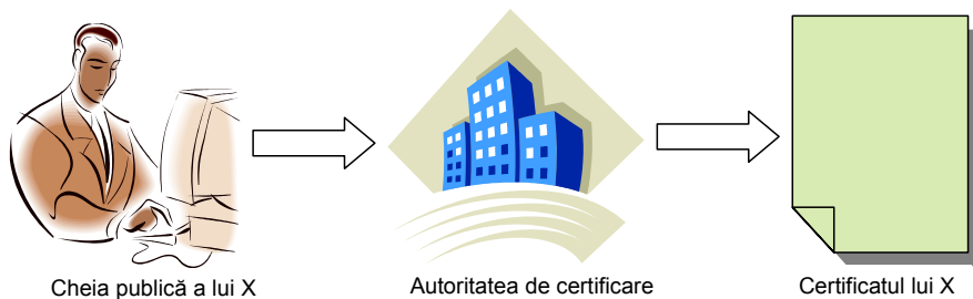
Fig. 1. Eliberarea unui certificat de către autoritatea de certificare

Certificatul digital confirmă identitatea utilizatorului și semnătura acestuia (Fig. 1). Pentru certificare, cheia publică a unui utilizator este înregistrată de către autoritatea de certificare într-o bază de date foarte bine protejată.