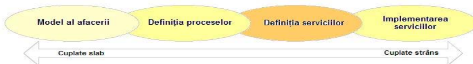
Fig. 2. Relația dintre modele și tipul interacțiunii

Implementarea proceselor într-un nivel separat dedicat proceselor facilitează considerabil agilitatea afacerilor, deoarece o schimbare în definiția procesului nu cere schimbarea funcționalității aplicațiilor suport. Procesele pot fi astfel rapid schimbate și reimplementate și solicită minimum de resurse de programare. Pe măsură ce funcționalitatea aplicațiilor devine mai granulat și mai brut definită, mai nefinisată, aplicațiile devin astfel mai orientate spre afaceri și mai puțin orientate spre