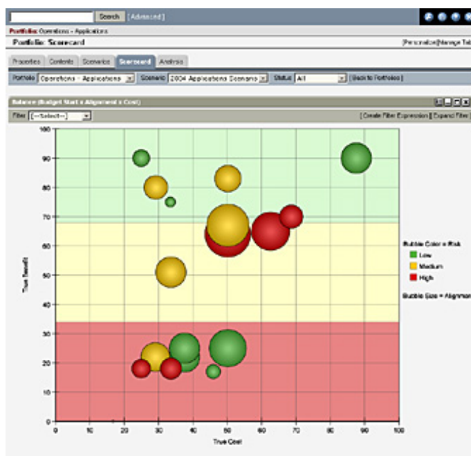
Fig.3. Diagramă a proiectelor în Clarity – Portfolio Manager

Avantajele principale ale Portfolio Manager sunt: